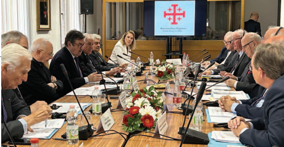
Der Generalgouverneur leitete die Sitzung des Großmagisteriums, deren Hauptthema die Unterstützung der Mutterkirche in Jerusalem war, die derzeit mit den schwerwiegenden humanitären Folgen des Krieges konfrontiert ist.

auch die Erhöhung der obligatorischen monatlichen Überweisung des Großmagisteriums an das Lateinische Patriarchat für dessen institutionelle Ausgaben, die seit Januar 2024 nunmehr 950.000 US-Dollar beträgt.