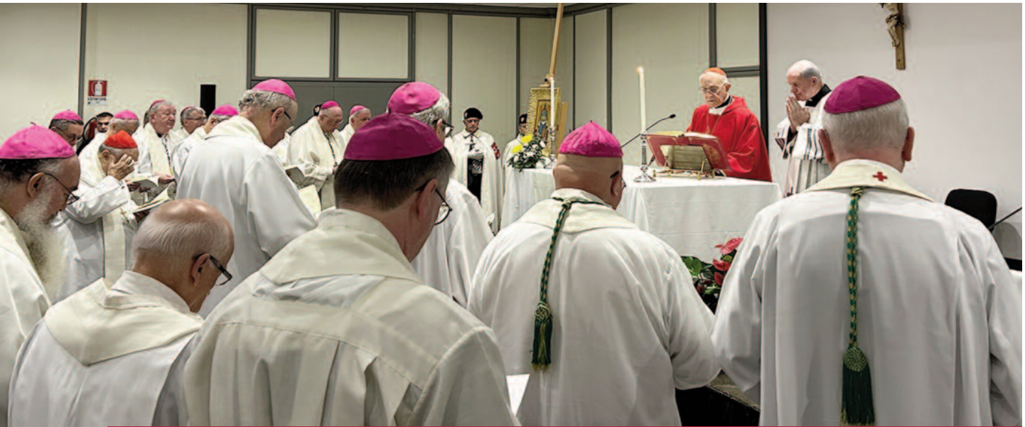
Morgenmesse unter Vorsitz des Großmeisters, die die Großprioren konzelebrierten, die bei der Consulta des Ordens im November 2023 anwesend waren.

Satzung und die Bestimmungen kennenlernen und mit den Laienverantwortlichen (Statthalter, Magistraldelegierte, Vorsitzende usw.) zusammenarbeiten sollen. Dies geschieht in dem Wissen, dass der Orden vom Heiligen Grab ein Laienorden mit alter Tradition ist, der vom Seligen Papst Pius IX. wiederhergestellt wurde, der ihn unauflöslich an die Unterstützung des Lateinischen Patriarchats von Jerusalem (1847) gebunden hat. Wie Sie wissen, hat Papst Franziskus die Satzung kürzlich (2021) aktualisiert.