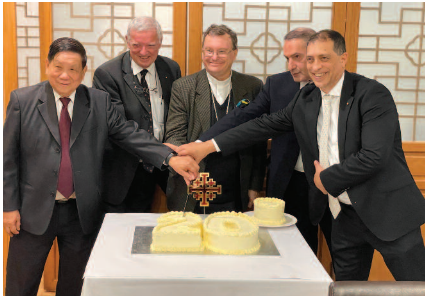
Die Geburtstagstorte symbolisierte das 20-jährige Bestehen der Statthalterei für Südastralien.