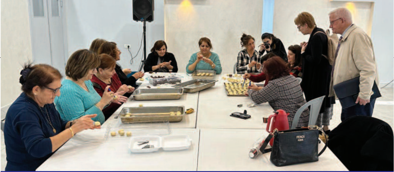
Da die wirtschaftlichen Bedingungen in der Region sehr schwierig sind, stellen einige Frauen in der Gemeinde Beit Sahour traditionelle Süßigkeiten her und verpacken sie. Diese werden verkauft, und die Einnahmen gehen an die örtliche Schule, um einen Beitrag zum Schulgeld zu leisten.