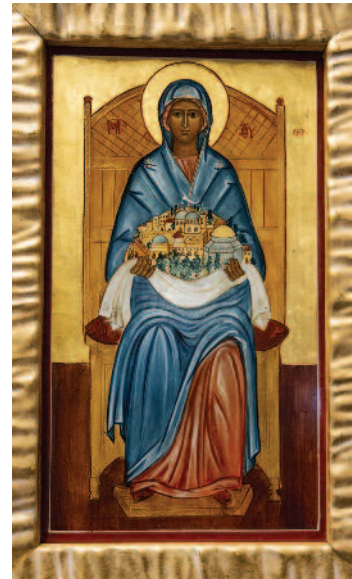
Un icono de Nuestra Señora de Palestina, pintado por las Hermanas de Belén, que representa a la Madre de Dios portando en su corazón la ciudad de Jerusalén y a sus habitantes de todas las confesiones, símbolo de la nueva humanidad.

Para los Caballeros y Damas del Santo Sepulcro, María pertenece a la Orden por diversas razones. Solo mencionaré dos, ambas espiritualmente profundas: la primera es que María no aparece mucho en la vida pública de Jesús; al contrario, casi parece como si – tanto en Caná de Galilea como a los pies de la cruz – María fuera rechazada por su Hijo, quien ya no la llamaba «madre», sino «mujer», que aparentemente quería concluir