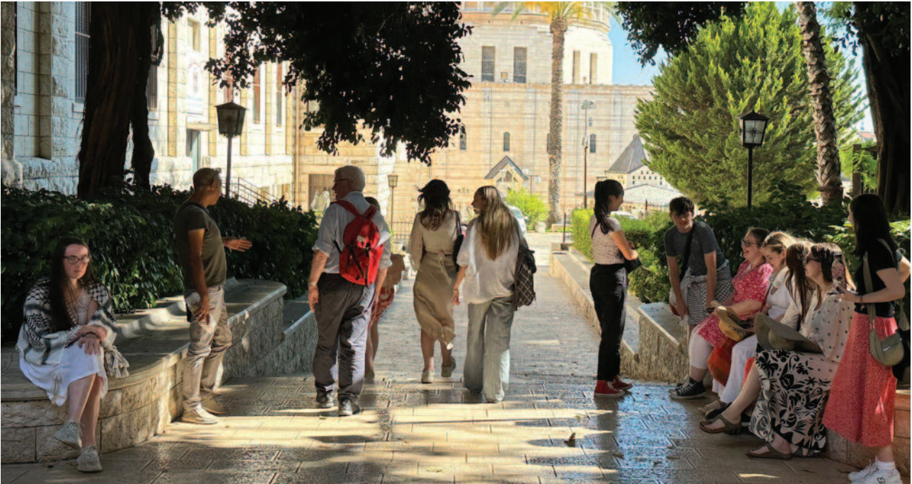
Los estudiantes de Glasgow y de la universidad de Belén han forjado amistades que ofrecen esperanzas de una futura colaboración.

ción, así como las oportunidades de interactuar con personas importantes cuyas generosas contribuciones han causado impresiones perdurables. Pasamos mucho tiempo en el Patriarcado latino, donde escuchamos y hablamos sobre el papel de la Iglesia católica en Tierra Santa, especialmente, en relación con la ayuda humanitaria».