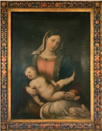
Una pintura de la Virgen con el Hijo de Dios en sus brazos adorna la sala del trono, en el Palazzo della Rovere, sede de la de Orden en Roma.

la nueva Ciudad Santa del Apocalipsis (Ap. 21,2) que, como una Madre benévola, la protege y la cuida. De igual forma, en la sede de la Orden se conserva una antigua imagen de María con el Hijo sobre sus rodillas. Observemos una analogía: casi podría decirse que la Iglesia, que reco-