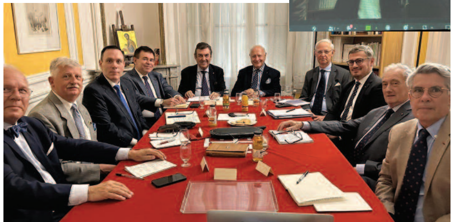
El Gobernador General, Leonardo Visconti di Modrone, rodeado del Vicegobernador para Europa, Jean-Pierre de Glutz, y de los Lugartenientes francófonos en París, durante una reunión de coordinación.