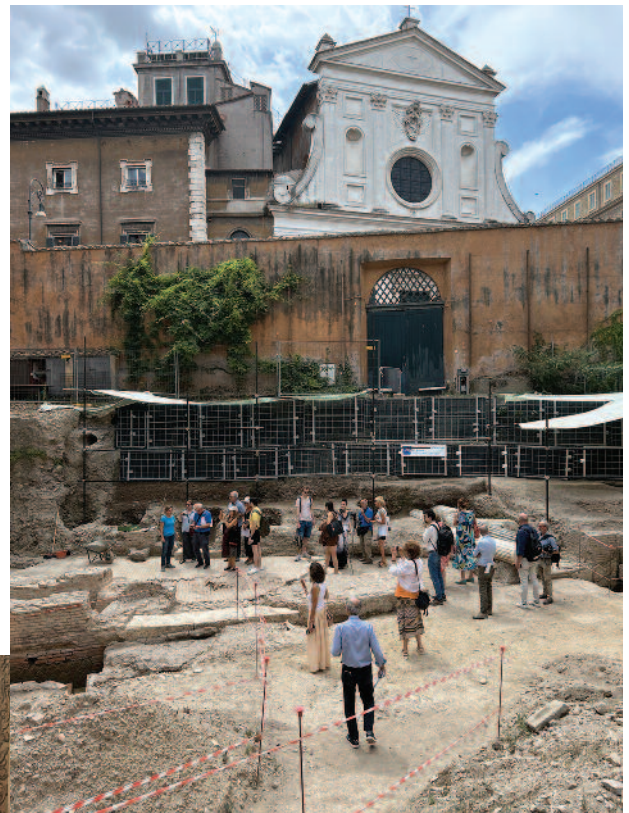
Rueda de prensa del 26 de julio de 2023 en el Palazzo della Rovere, para presentar los recientes descubrimientos arqueológicos.

mientos y, de igual forma, presentan la misión de la Orden del Santo Sepulcro de promover la cultura del encuentro en Tierra Santa.