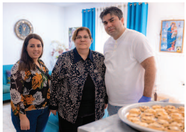
Gracias al proyecto AFAQ, una familia de Tierra Santa ha recibido ayudas en apoyo a su pequeña empresa de producción de pasteles, elaborados en su domicilio.

interactiva y dinámica centrada en las competencias necesarias para entrar en el mercado laboral; se ha formado en orientación profesional a los trabajadores sociales de 17 colegios para que atiendan mejor a sus alumnos y los ayuden a descubrir sus aptitudes y las oportunidades profesionales y de estudio que se les ofrecen; 19 startups recibieron una ayuda de 3000 dólares cada una; 29 pequeñas empresas ya existentes han recibido una subvención de 2000 dólares para mejorar su actividad y aumentar sus ingresos; 47 diplomados sin empleo han tenido la posibilidad de realizar unas prácticas de una duración de 3 a 6 meses, destinadas a ayudarlos a entrar en el mundo laboral. Al final del proyecto, más del 40 % obtuvieron un contrato de trabajo indefinido, por lo que dejan de ser desempleados; 63 jóvenes y mujeres se han beneficiado de una beca de estudios pa-