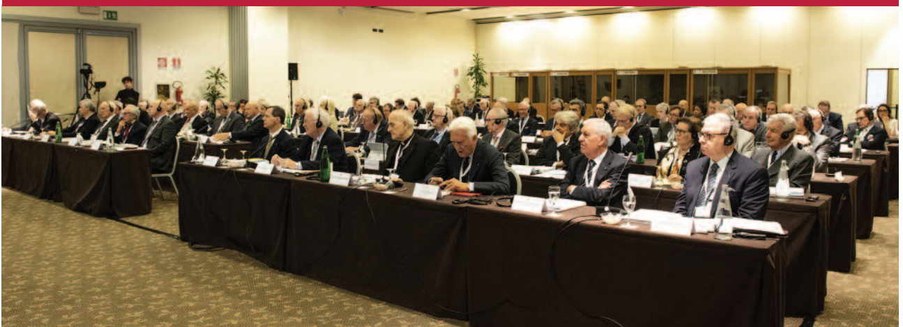
Los participantes de la Consulta de la Orden en 2018, durante una sesión de trabajo.

La Consulta es el principal órgano consultivo del Gran Maestre en un espíritu sinodal y, como se lee en el Estatuto, «no es un órgano deliberativo, pero sus propuestas forman