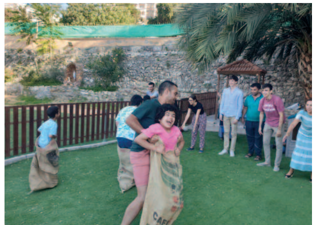
Los jóvenes de la Lugartenencia para España Occidental pudieron realizar una experiencia de diferentes servicios en Tierra Santa, especialmente con niños discapacitados.

Los jóvenes tuvieron la oportunidad de vivir varias experiencias de servicio repartidos en grupos: algunos ayudaron a las Hermanas del Verbo Encarnado que trabajan en el Hogar Niño Dios (casa para niños con discapacidad), realizando algunas tareas de limpieza y preparación de espacios para acoger en otra casa de Beit Sahour a niños mayores con discapacidad para los que la mejor solución es tener su propio entorno y no estar en estrecho contacto con los niños más pequeños acogidos en Belén. Otro grupo prestó