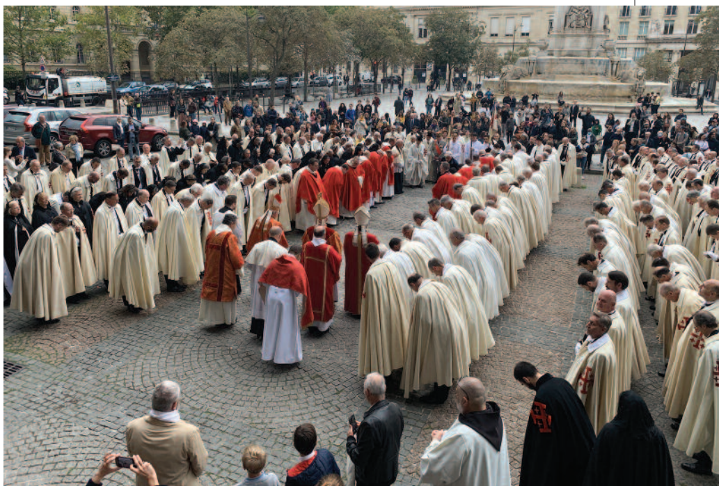
Los nuevos miembros de la Lugartenencia para Francia y de la Lugartenencia para Luxemburgo fueron investidos en la iglesia de San Sulpicio, en París, en presencia de numerosos Caballeros y Damas.