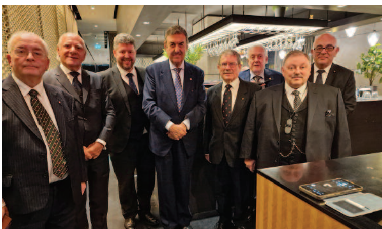
Los Lugartenientes y Delegados Magistrales de los países de lengua inglesa (Inglaterra, País de Gales, Escocia, Irlanda, Gibraltar y Sudáfrica) se reunieron con el Gobernador General en Londres, al margen de las ceremonias de Investidura.