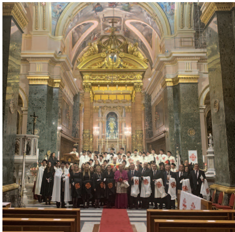
La Vigilia y la ceremonia de Investidura de la Lugartenencia maltesa tuvieron lugar respectivamente en la basílica colegiata de la Natividad de la Virgen en Senglea (nuestra foto) y en la catedral metropolitana de San Pablo en Mdina.