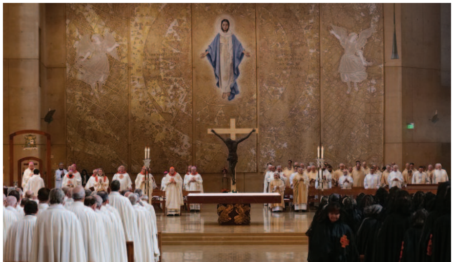
Celebración de investidura en la iglesia de Nuestra Señora de los Ángeles en Los Ángeles, California.

El cardenal Filoni, Gran Maestro, nos habló de la importancia de la espiritualidad como miembros de la Orden y nos retó a mejo-