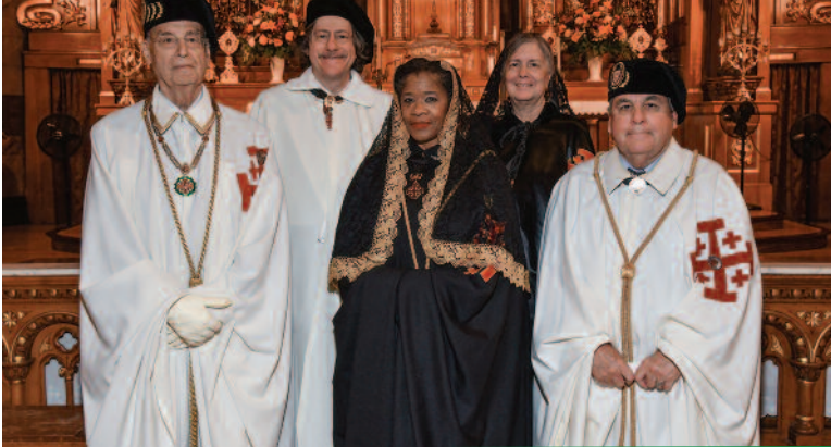
El lugarteniente general Agostino Borromeo representó al Gran Magisterio en Chicago.