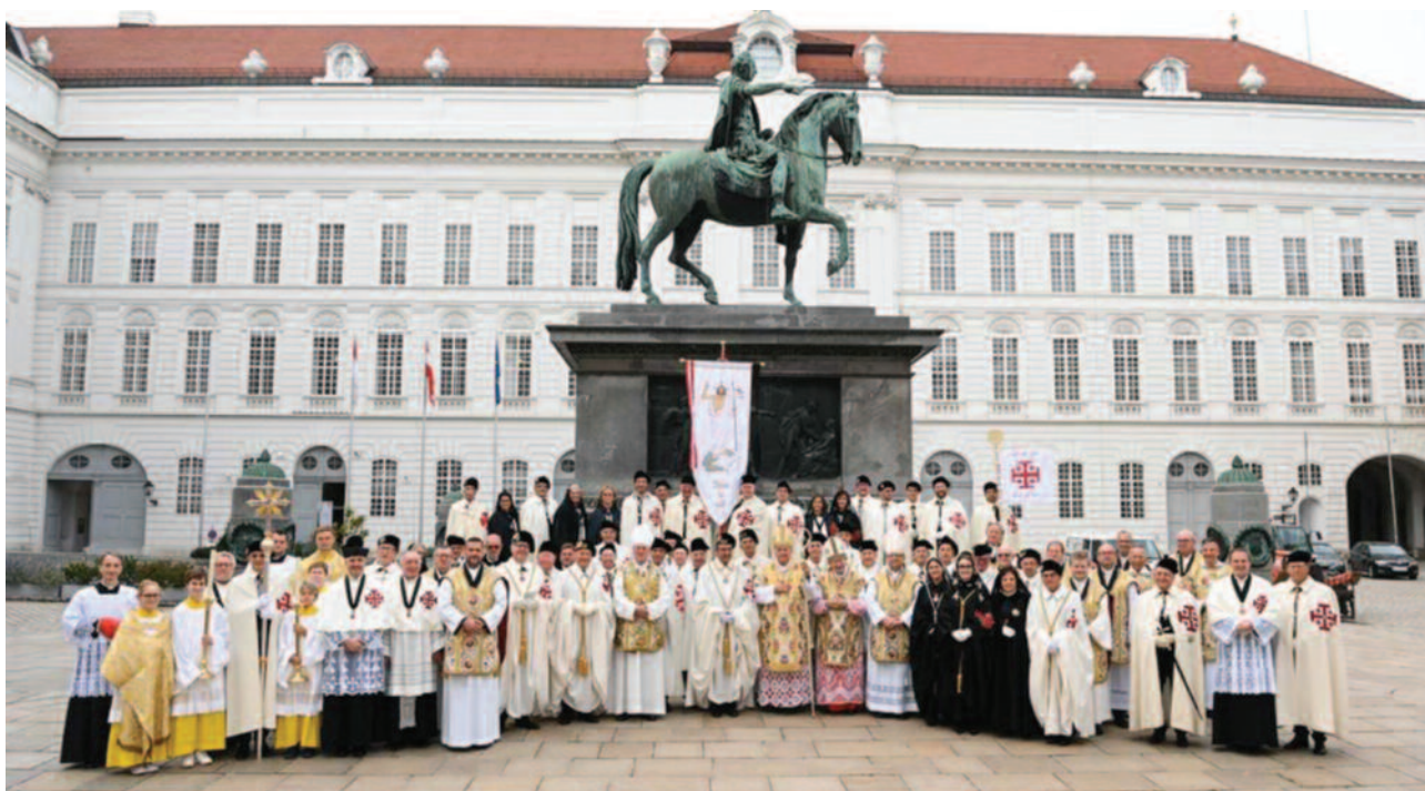
Varias Lugartenencias estuvieron representadas en las Investiduras de Viena.

la unidad de la Orden respetando al mismo tiempo la diversidad de tradiciones. El nuevo Ritual, el compromiso de una mayor implicación espiritual y la generosidad hacia la Iglesia Madre de Jerusalén, deben ser compartidos por todas las Lugartenencias, conscientes de que juntos encarnan una finalidad clara de la Iglesia y un deber establecido pa-