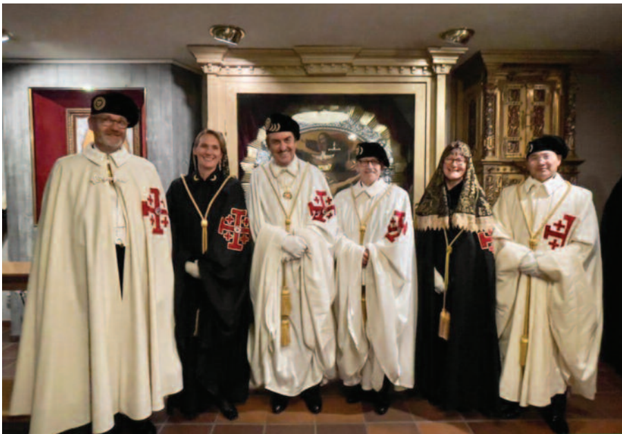
Encuentro de los Lugartenientes de los países del Norte de Europa en Estocolmo, Suecia, en torno al Gobernador General, el embajador Leonardo Visconti di Modrone.

Además del Gobernador General y del Vicegobernador para Europa, Jean-Pierre de Glutz, estuvieron presentes los lugartenientes de Austria, Bélgica, Alemania, Inglaterra y Gales, Luxemburgo, Países Bajos, España Oriental, Eslovenia, Suiza y Liechtenstein. En su discurso a los numerosos participantes en la cena de gala posterior a las investiduras en Viena, el Gobernador General instó a los presentes a reforzar