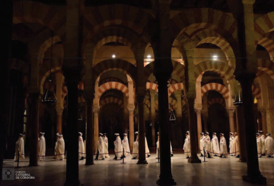
La Investidura de la Lugartenencia para España Occidental fue celebrada en la Catedral de Córdoba.