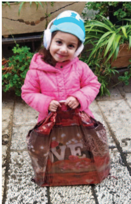
La Orden del Santo Sepulcro también participa en la compra de regalos que se ofrecen a los niños de Tierra Santa cuyas familias se encuentran con dificultades.