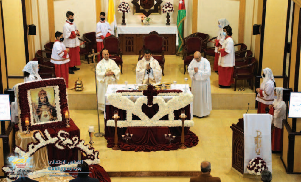
En Misdar, uno de los barrios más pobres de Ammán (Jordania), la parroquia ha crecido considerablemente a lo largo de los años. La Orden se ha hecho cargo de las obras en la Iglesia de Cristo Rey.

de Smakiyeh, que incluía la iglesia y la casa del cura, así como la sala polivalente. La parroquia, situada en una zona marginada de las afueras de la capital, Ammán, llevaba décadas sin renovarse. Gracias a este proyecto, el Patriarcado latino ha podido crear un entorno pastoral propicio para vivir, rezar y asistir a misas y actos parroquiales.