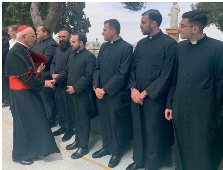
Recibimiento del Gran Maestro en el seminario de Beit Jala.