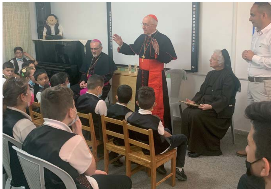
El cardenal Filoni durante una conversación con alumnos de una escuela de Palestina.

Tras el encuentro en el que el Gran Maestro insistió mucho sobre la importancia de la