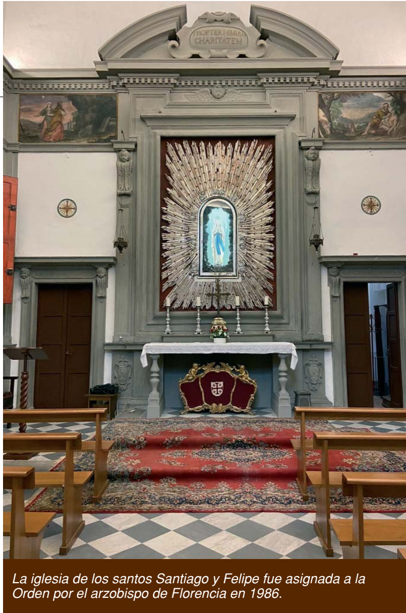
La iglesia de los santos Santiago y Felipe fue asignada a la Orden por el arzobispo de Florencia en 1986.

En 1821, la iglesia y las dependencias de