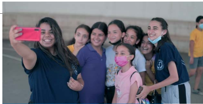
El apoyo de la esperanza en Gaza.