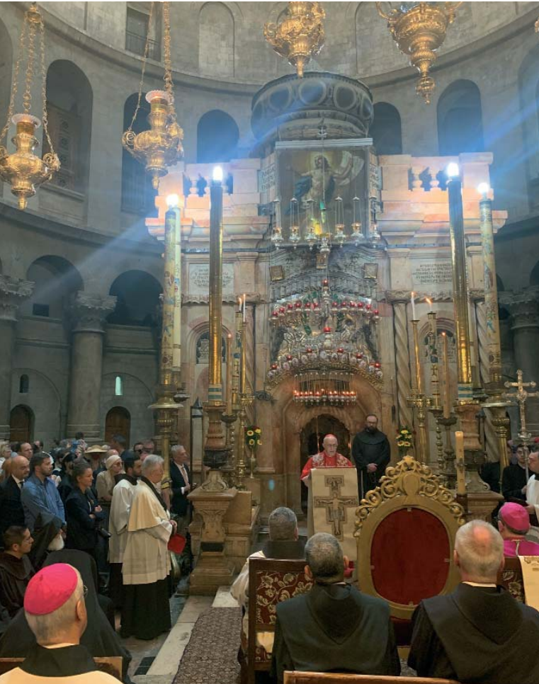
El Gran Maestro de la Orden hablando delante del edículo del Santo Sepulcro.

conservada por su familia desde hace siglos.