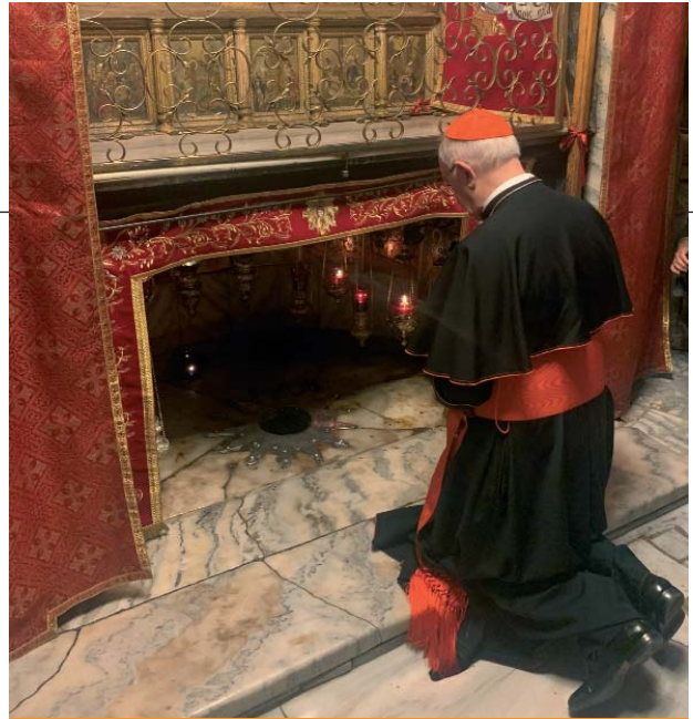
Momento de oración en la gruta de la Natividad, seguido de una visita a los niños con discapacidad del Hogar Niño Dios en Belén.