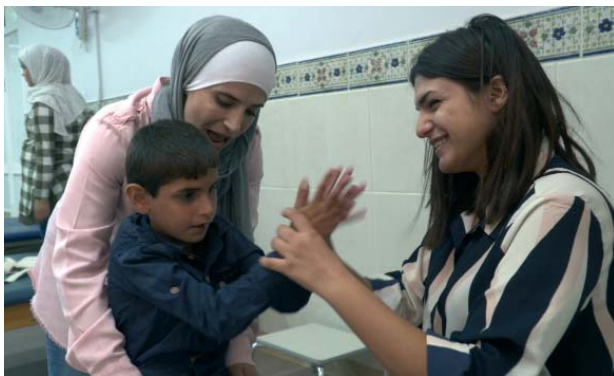
La ayuda a las personas pobres.

En Jordania, el Centro Nuestra Señora de la Paz se esfuerza por «ayudar a los más pobres entre los pobres, especialmente a las personas con discapacidad». El padre Shawki