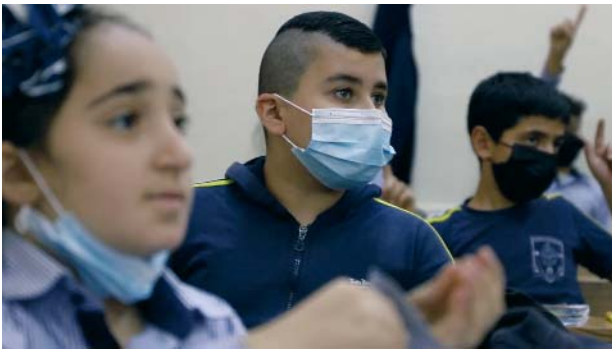
Las actividades pastorales, especialmente al servicio de los jóvenes.

rales y litúrgicas en toda Tierra Santa a través de su Oficina litúrgica, su Oficina catequética y su Oficina pastoral. Gracias al apoyo de la Orden del Santo Sepulcro, estas tres oficinas pueden ampliar su campo de acción y organizar numerosos eventos y actividades.