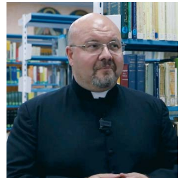
La formación de los sacerdotes en el seminario.