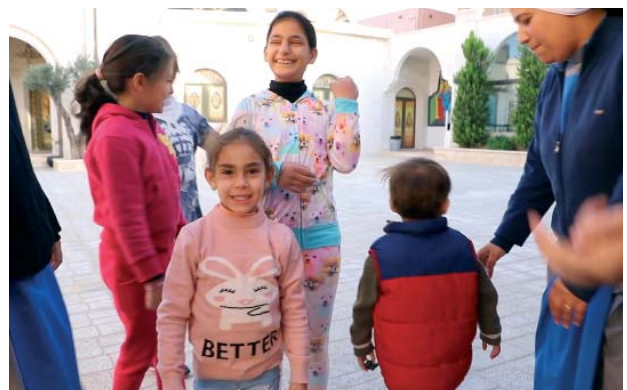
El cuidado de las personas con dificultades, por ejemplo, los huérfanos.