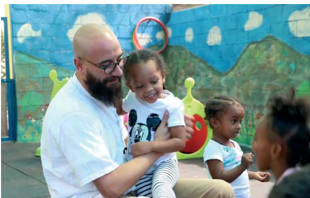
La acogida de los hijos de los trabajadores extranjeros y de los inmigrantes.

Otra realidad muy querida por la Orden es el Vicariato de Santiago para los católicos