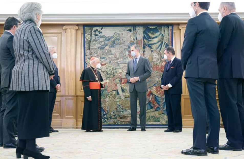
El rey de España recibiendo al Gran Maestre y a los máximos representantes de la Orden en Madrid el pasado mes de abril.

compromiso con la obra de caridad en Tierra Santa, comentando sus palabras.