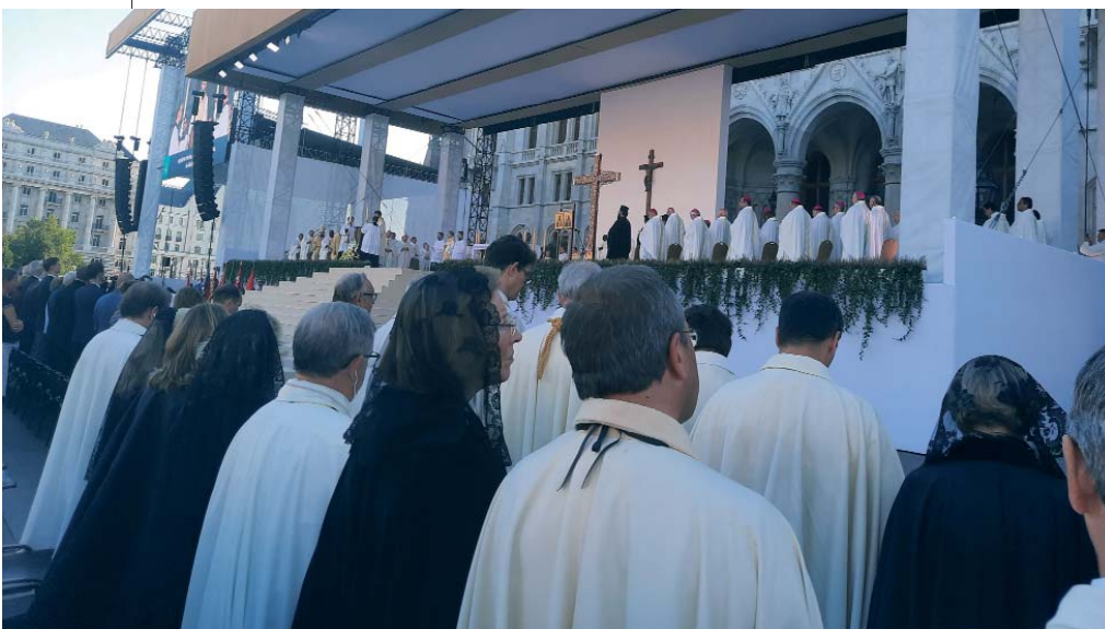
L'Ordine del Santo Sepolcro collabora alla rinascita spirituale dell'Europa, auspicata dal cardinale Erdő a Budapest.

Articolo scritto à partire da una relazione ricevuta da Márk Aurél Érszegi, Segretario della Luogotenenza per l'Ungheria