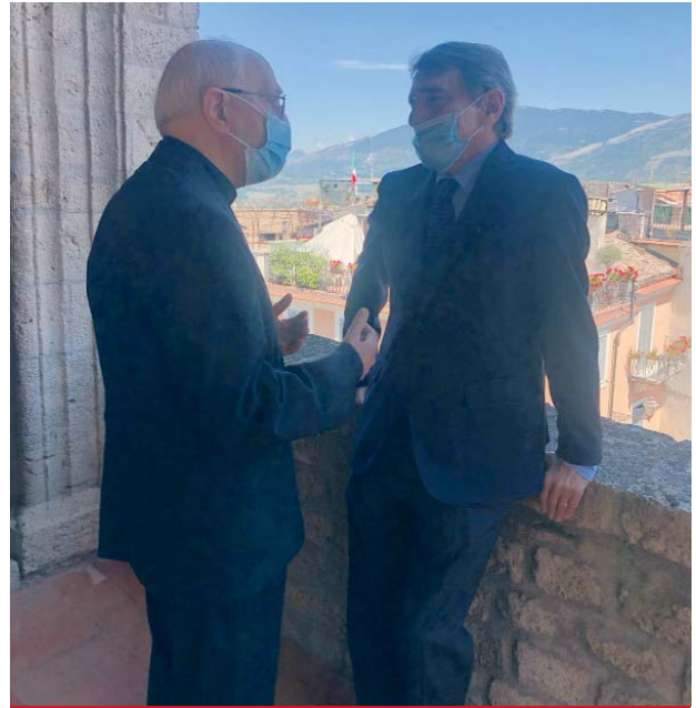
Il Gran Maestro e il presidente del Parlamento europeo David Sassoli hanno parlato a lungo delle radici cristiane dell'Europa, nel corso della cerimonia di consegna del Premio internazionale Bonifacio VIII al Cardinale Fernando Filoni.

Il contesto di oggi è sicuramente differente, ma anche in questo 2021 ci sentiamo tan-