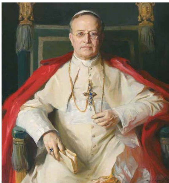
Papa Pio XI, che fu Gran Maestro dell'Ordine del Santo Sepolcro, si adoperò molto per il sostegno ai cristiani di Terra Santa.

di Gerusalemme». Il compito dell'Opera istituita precedentemente dal Patriarca di Gerusalemme era quello di occuparsi «(...) in molteplici maniere dell'incremento e della salvaguardia della Religione cattolica, promuovendo scuole, pubblicando utili libri, aprendo società e circoli con scopi di opportuna istruzione o di onesto divertimento». Il Patriarca di Gerusalemme, Mons. Luigi Barlassina (1928-1947), prendeva in mano l'organizzazione delle due istituzioni, per far fronte alla situazione cristiana in Pale-