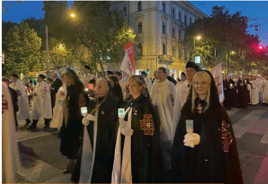
La partecipazione di Cavalieri e Dame al Congresso Eucaristico Internazionale ha dimostrato l'impegno dei membri dell'Ordine nella vita della Chiesa universale.

Dopo la Messa dell'11 settembre 2021, presieduta da S.Em. il Card. Péter Erdő, Primate d'Ungheria, Arcivescovo di Esztergom-Budapest e Gran Priore della Luogotenenza per l'Ungheria, di fronte al Palazzo del Parlamento ungherese, una grandiosa processione