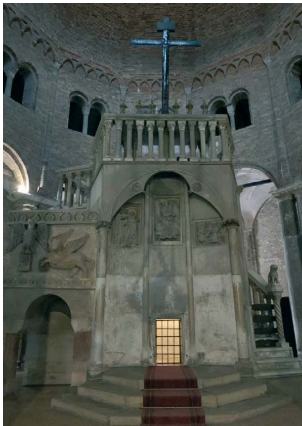
La reproduction du Saint-Sépulcre à Bologne a marqué symboliquement l'ouverture et la clôture de ce grand rendez-vous des leaders religieux et politiques dans le cadre du Forum interreligieux du G20.

C'est dans l'église San Stefano à Bologne, où se trouve une grande reproduction du Saint-Sépulcre de Jérusalem, que le G20 du dialogue s'est ouvert, le 11 septembre, par une prière interreligieuse pour toutes les victimes d'attentats commis dans des lieux de culte.