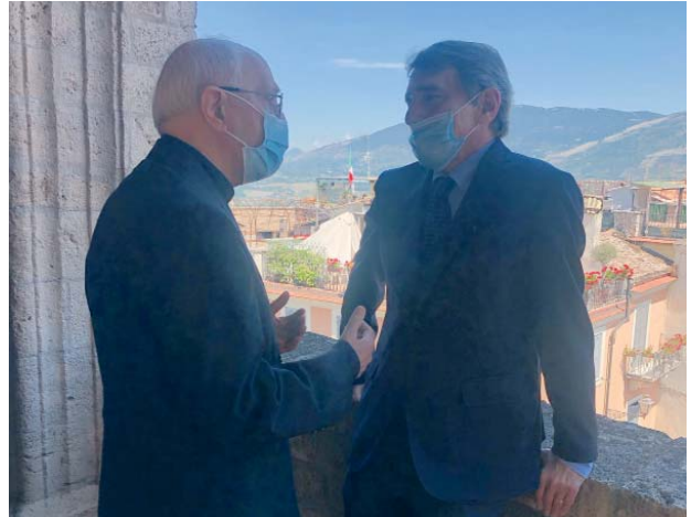
Le Grand Maître et le président du Parlement européen, David Sassoli, se sont longuement entretenus au sujet des racines chrétiennes de l'Europe lors de la remise du prix international Boniface VIII au cardinal Fernando Filoni.