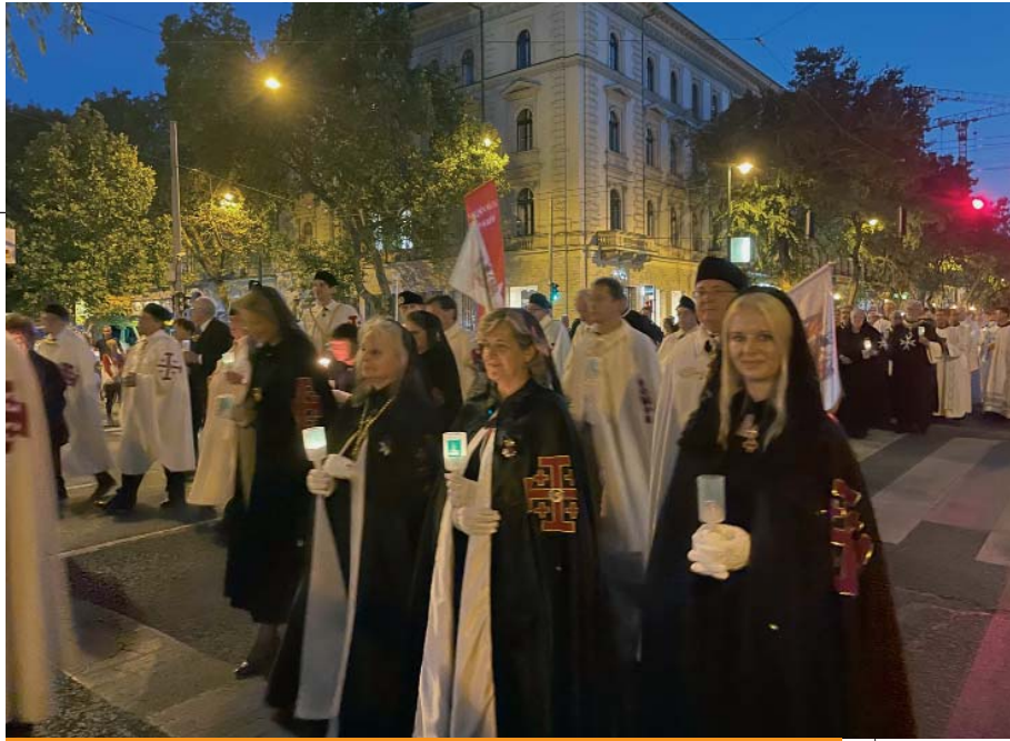
La participation des Chevaliers et Dames au congrès eucharistique international a manifesté l'engagement des membres de l'Ordre au cœur de la vie de l'Eglise universelle.

Après la messe du 11 septembre 2021, présidée par le cardinal Péter Erdő, Primat de Hongrie, archevêque d'Esztergom-Budapest et Grand Prieur de la Lieutenance pour la Hongrie, devant le bâtiment du Parlement hongrois, une grande procession eucharisti-