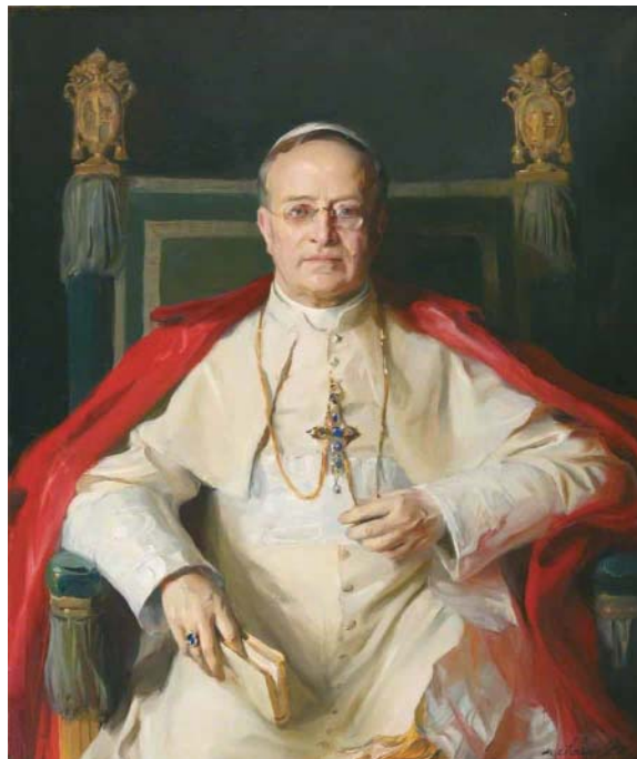
Le Pape Pie XI, qui fut Grand Maître de l'Ordre du Saint-Sépulcre, a beaucoup œuvré pour le soutien aux chrétiens de Terre Sainte.

D ans les années du pontificat du Pape Pie XI (1922-1939), les vicissitudes de la Palestine continuent d'intéresser la diplomatie internationale sur la question de Jérusalem et des Lieux Saints. La Déclaration Balfour de 1917, avec l'engagement du protectorat britannique de créer un « foyer national juif » en Palestine, est la trame sur laquelle va se tisser l'activité pontificale. Voici les mots prononcés par le Pape le 11 décembre 1922 : « (...) Nous sommes toujours très inquiets de ce qui se passe en Palestine, cette terre bénie (...) À l'heure où les représentants des puissances auprès de la Société des Nations devraient prochainement s'occuper à nouveau de la question palestinienne, nous faisons nôtres la revendication et la demande de notre prédécesseur : Nos velle ut cum maturitas Palaestinae ordinandae venerit, Ecclesiae catholicae christianisque universis ibi salva et incolumia iura sint (...) ». 1 La sollicitude pastorale de Pie XI lui fit entreprendre des activités en soutien aux chrétiens de Palestine, dépassant la conception d'une évangélisation qui aurait oublié l'identité des différentes commu-