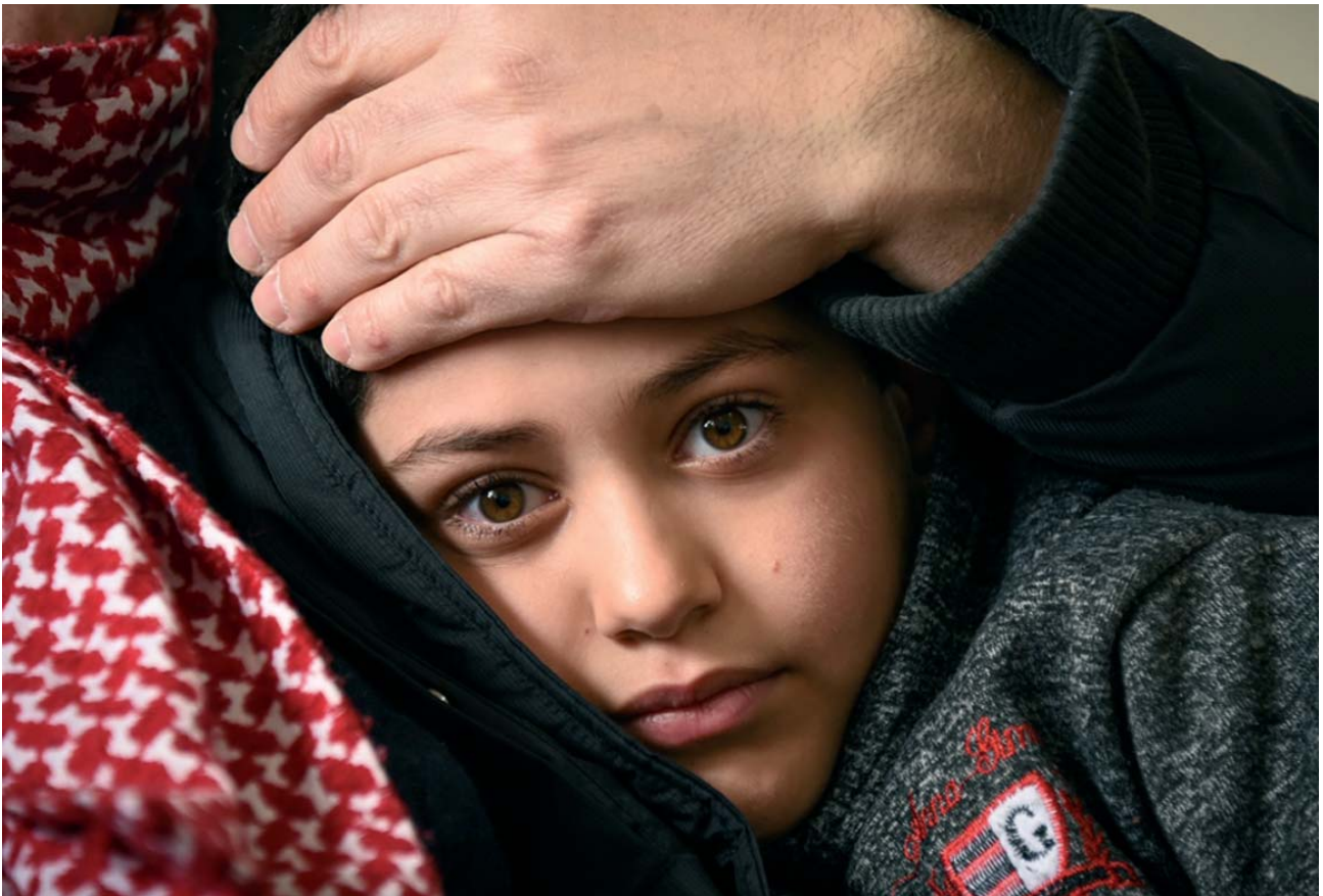
Les chrétiens irakiens réfugiés en Jordanie, pays situé sur le territoire du Patriarcat latin de Jérusalem, peuvent compter sur l'aide de l'Ordre du Saint-Sépulcre depuis plusieurs années.

mique ont obligé encore plus de personnes à fuir, en particulier les minorités, pour tenter d'avoir la vie sauve.