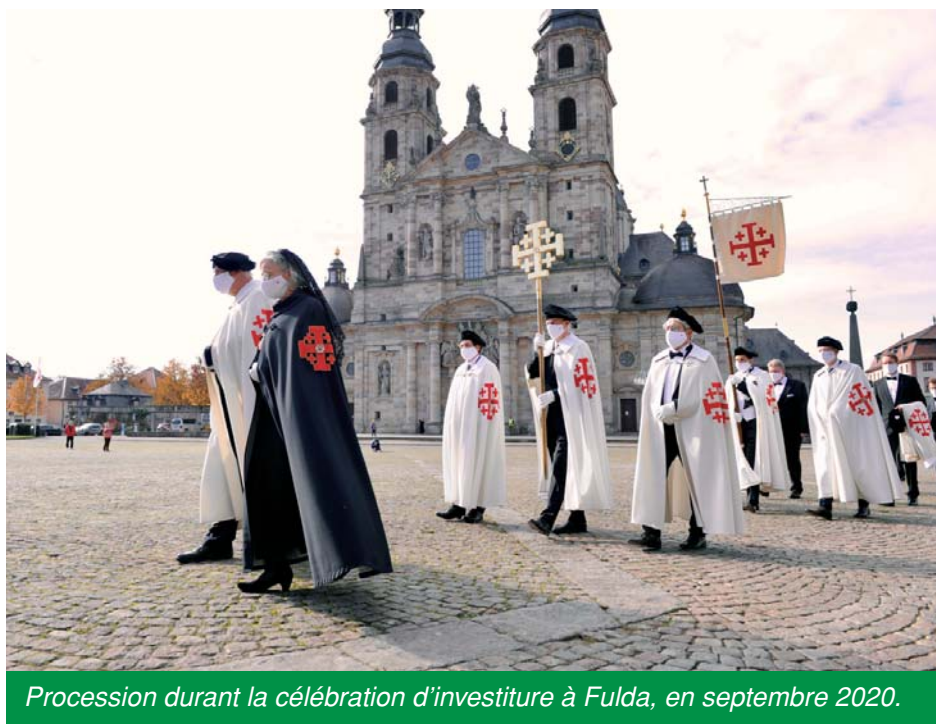
Procession durant la célébration d'investiture à Fulda, en septembre 2020.

tivité pour pouvoir tenir leurs réunions : on a organisé des pèlerinages dans les environs et des processions où on respectait des distances importantes. On s'est réuni dans les jardins des frères et sœurs de l'Ordre et célébré des messes en plein air. Des récitals d'orgue ont été organisés, et la première excursion familiale adaptée à la situation sanitaire a eu lieu. Les réunions des commanderies ont été