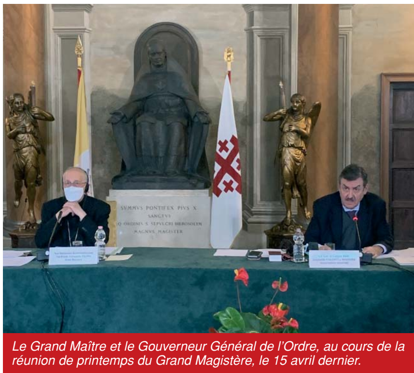
Le Grand Maître et le Gouverneur Général de l'Ordre, au cours de la réunion de printemps du Grand Magistère, le 15 avril dernier.