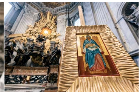
El cardenal Fernando Filoni celebró la misa en la Basílica de San Pedro con motivo de la fiesta de la patrona de la Orden del Santo Sepulcro.