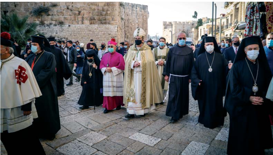
Mons. Pizzaballa en las calles de Jerusalén, durante la procesión que lo llevó al Santo Sepulcro, donde hizo su entrada oficial a principios de diciembre.