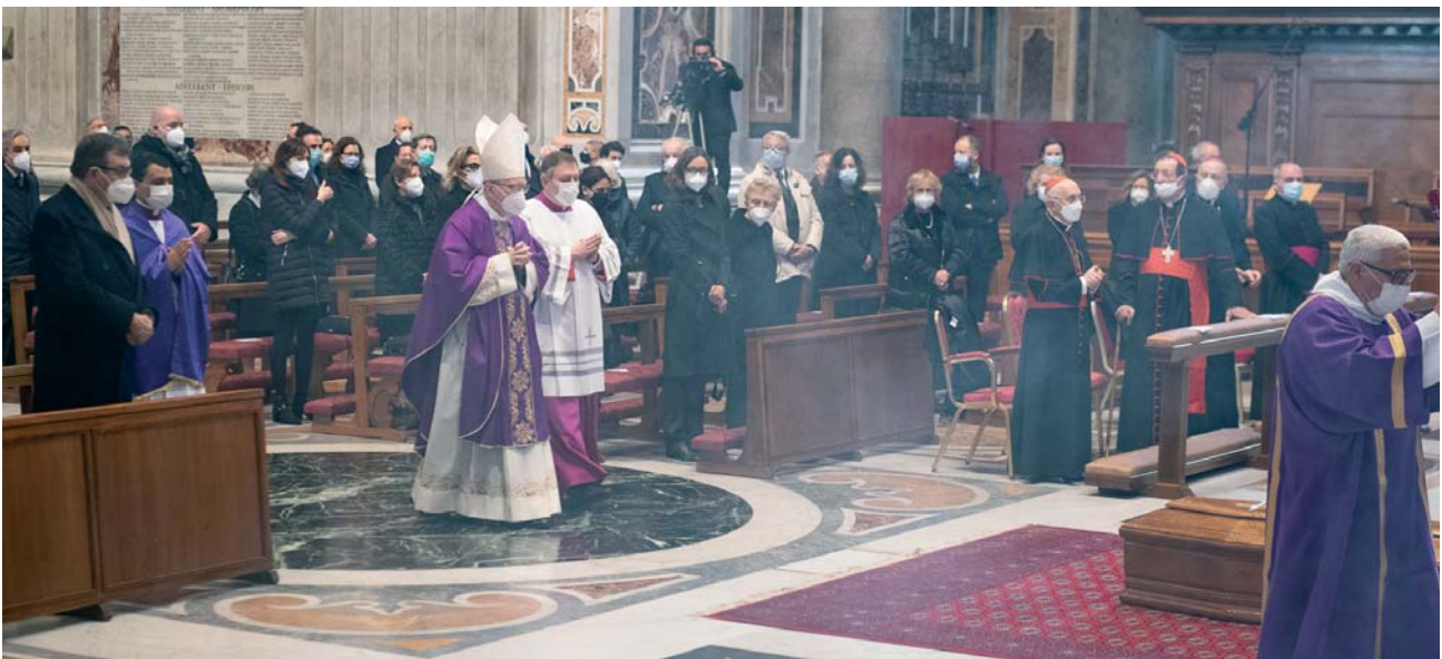
El funeral del Lugarteniente General de Honor fue presidido por el cardenal Pietro Parolin, Secretario de Estado de Su Santidad el papa Francisco.