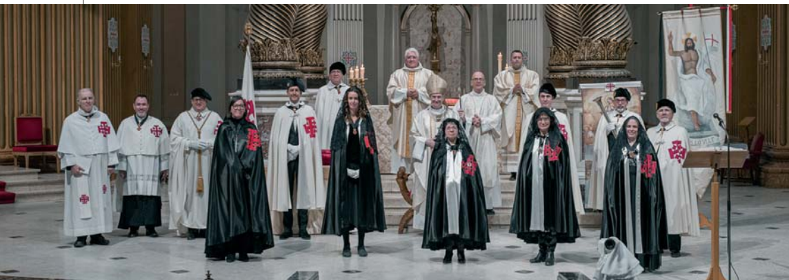
Investidura de Caballeros y Damas en la Lugartenencia de Canadá-Montreal.