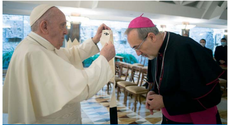
El Santo Padre entregó el palio al nuevo Patriarca de Jerusalén durante una misa celebrada en la capilla de la residencia Santa Marta.

ñar lo en su servicio pastoral y responder a todas sus sugerencias para implicarse significativamente en la vocación de la Tierra de Jesús como un lugar abierto, acogedor y amado por todos, donde conviven personas y esperanzas.