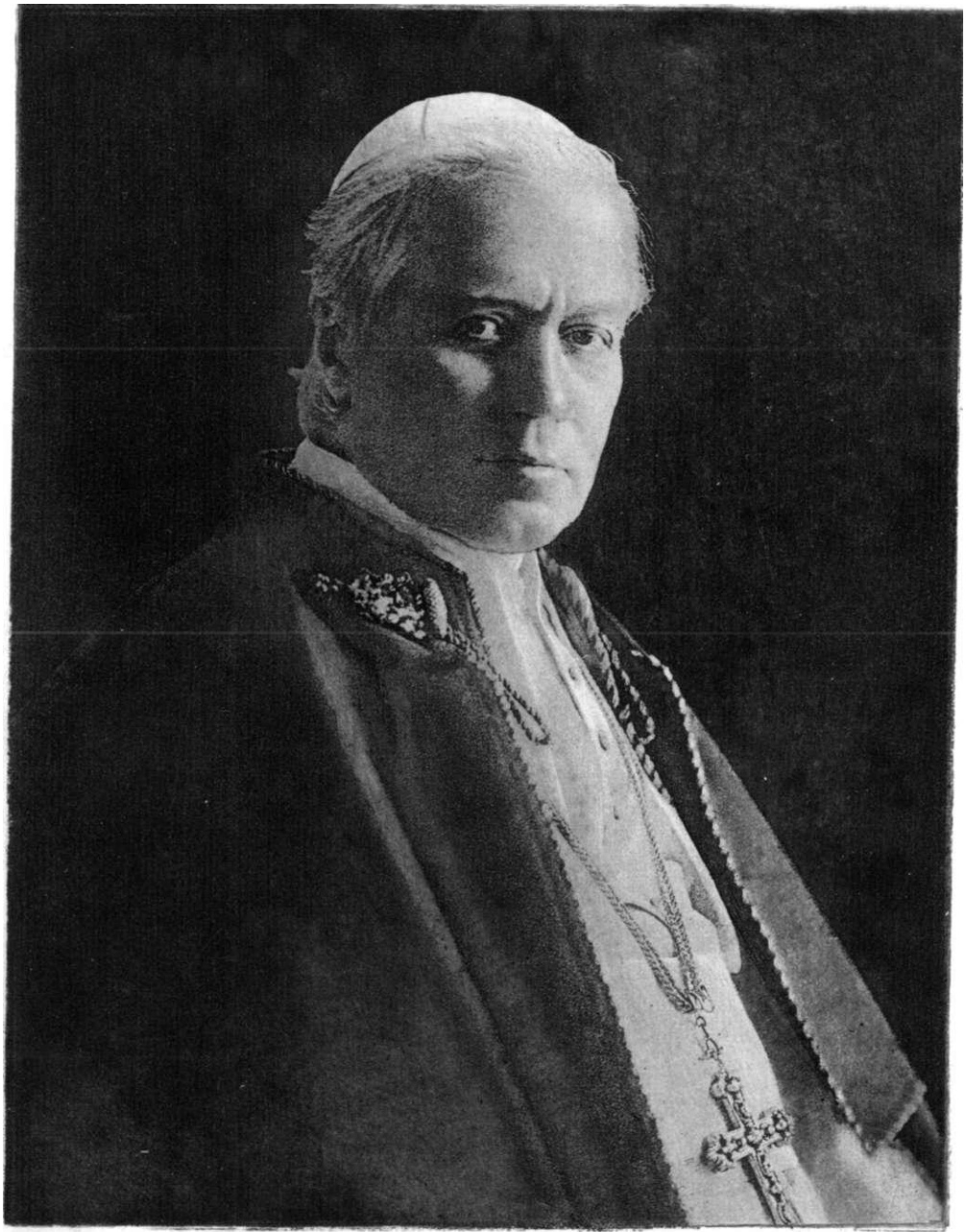
PIUS XI. VATICANO - ROMA